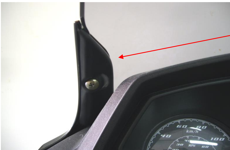
Fitting for the Downtown 125I / 300I ABS 2015 only